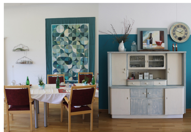
Gemütliche Gestaltung des Wohnzimmers im Altenheim Lohmar