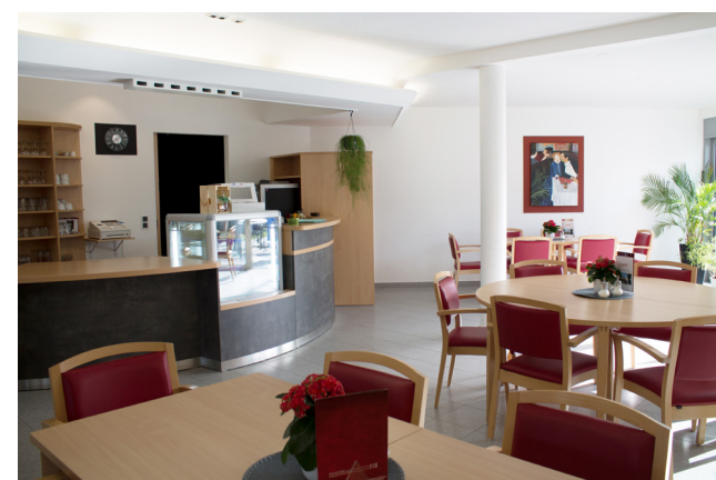
Café im Altenheim Lohmar