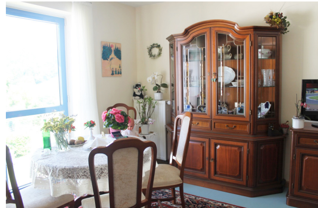
Sie können Ihre eigenen Möbel mitbringen und Ihr Zimmer ganz nach Ihrem Geschmack einrichten