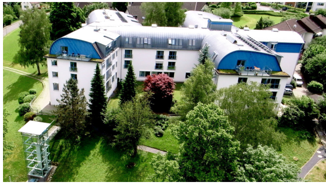
Luftbild des Evangelischen Altenheim Wahlscheid mitten im Zentrum des Ortes