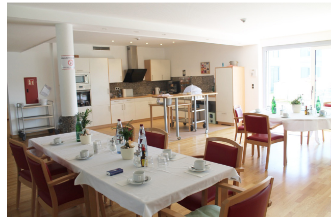
Wohnzimmer mit integriertem Küchenbereich im Altenheim Lohmar