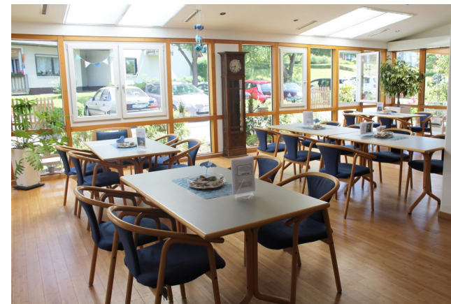
Café im Altenheim Wahlscheid