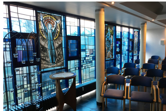
Kapelle im Altenheim Wahlscheid