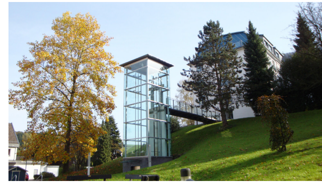
Außenbereich des Altenheims Wahlscheid mit Aufzug an der Wahlscheider Straße

Für alle die es mögen, gibt es auch das ein oder andere ereignisreiche Fest zum Mitmachen oder Zuschauen. Und wie das in einem Haus des Lebens so üblich ist, trifft man hier und da sogar Kinder aus den Kindergärten unserer Kirchengemeinden!