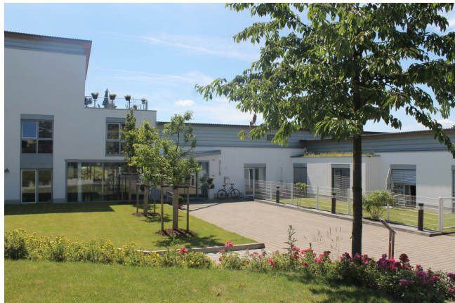
Eingang des Evangelischen Altenheim Lohmar hinter der Villa Friedlinde an der Bachstraße