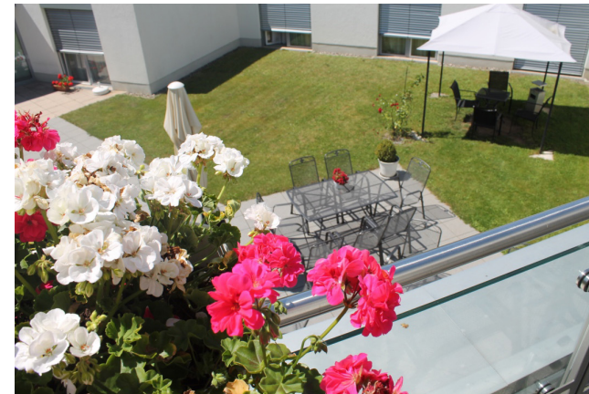
Außenbereich des Altenheim Lohmar